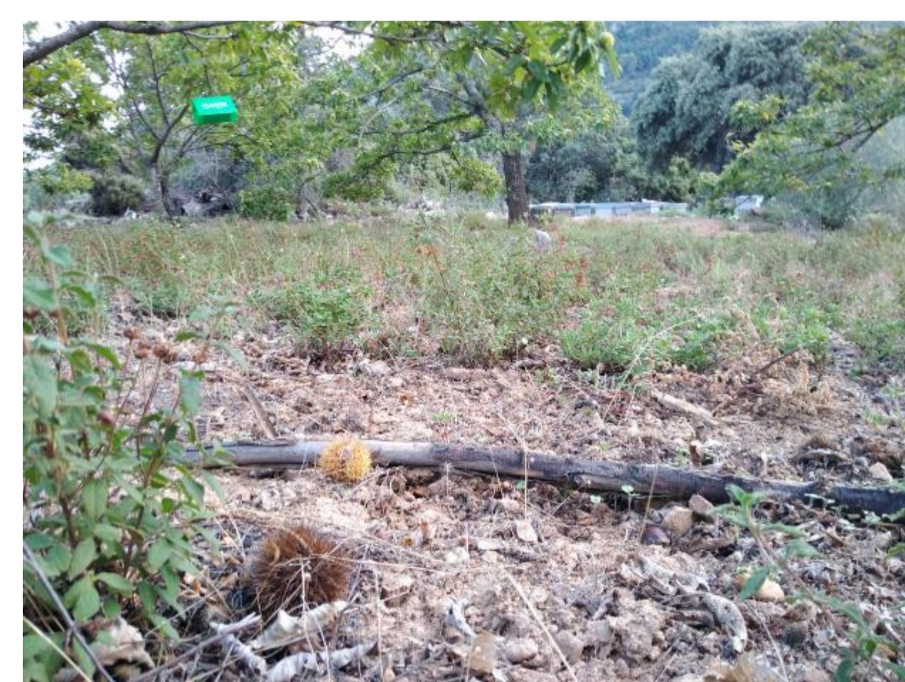
Siembra de plantas melíferas, como cantueso ( Lavandula stoechas ) obtenida de plantas del lugar y siembra de mostaza blanca ( Sinapis alba ), que además de servir de alimento para polinizadores, parte se utilizará como abono verde.