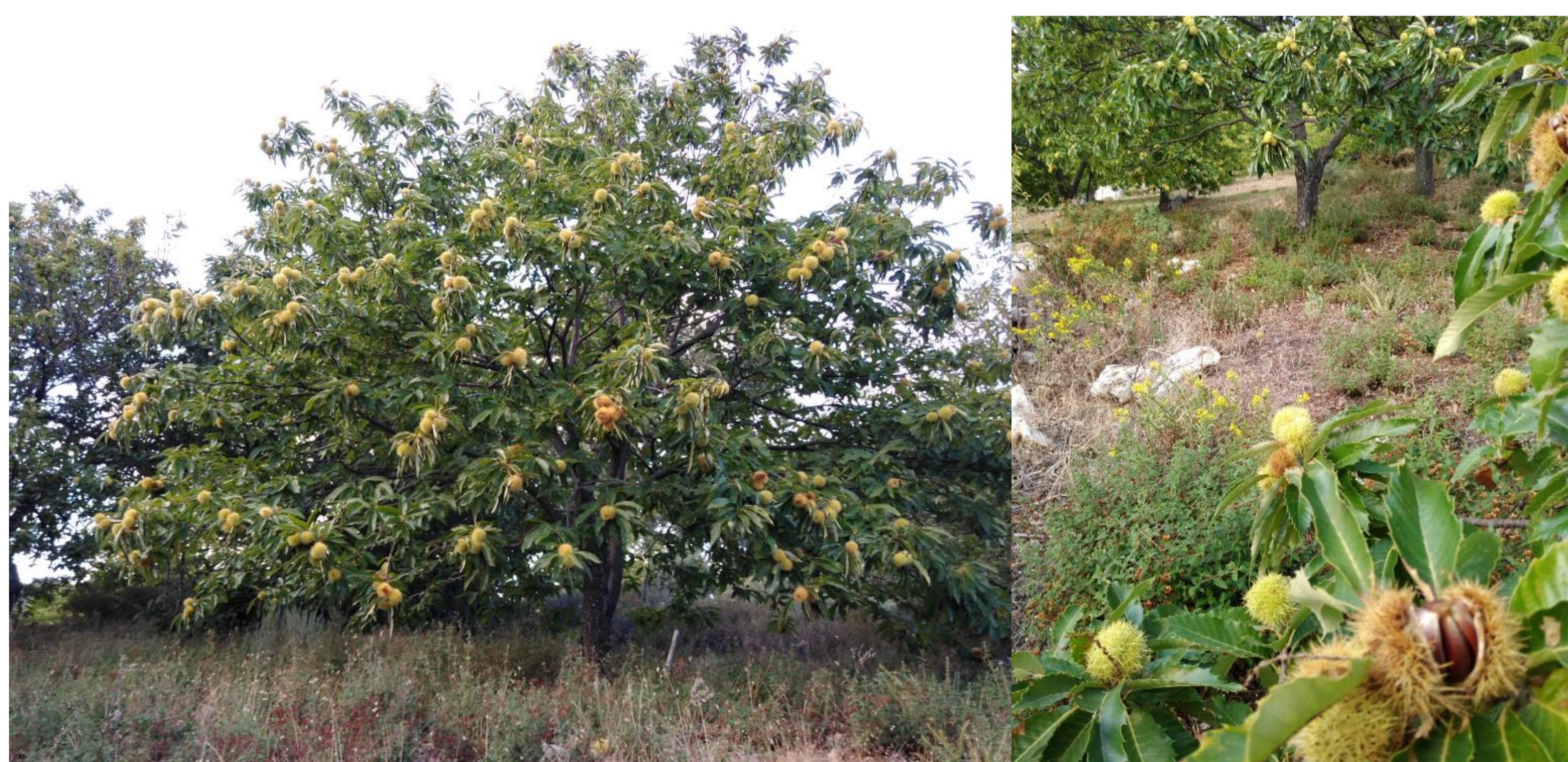
Imágenes de parcela sin laboreo ni herbicidas, no muestra señal de escorrentía tras intensa lluvia.

Sin la aplicación de herbicidas y tras más de tres años sin prácticas de laboreo se ha observado la falta de escorrentía. Además poco a poco se observa incremento de plantas arvenses en las lindes y se observa un incremento de la materia orgánica, tras el desbrozado de parte de la flora arvense en alguna época del año y la descomposición de las hojas y erizos. Los microorganismos del suelo son los responsables que las plantas puedan alimentarse porque son los encargados de solubilizar los elementos químicos y hacerlos asequibles para las plantas. Un suelo sano determina una planta sana. La fertilidad del suelo depende de su capacidad para mantener una variada diversidad de microorganismos. En definitiva, se ha observado un aumento de la biodiversidad, con los beneficios ambientales que conlleva para el cultivo y para el medio ambiente en general.