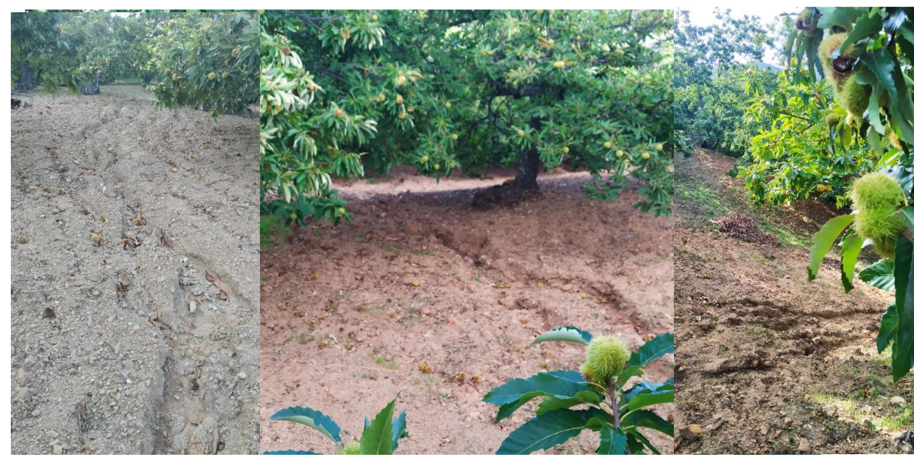
Imágenes de parcela con laboreo y mostrando escorrentía y pérdida de suelo tras intensa lluvia.