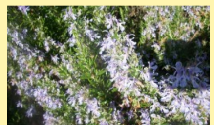
Floración de romero