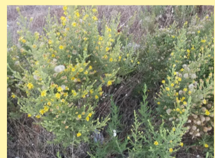
Altabaca, planta aliada de la agricultura ecológica, refugios de insectos beneficiosos para controlar plagas