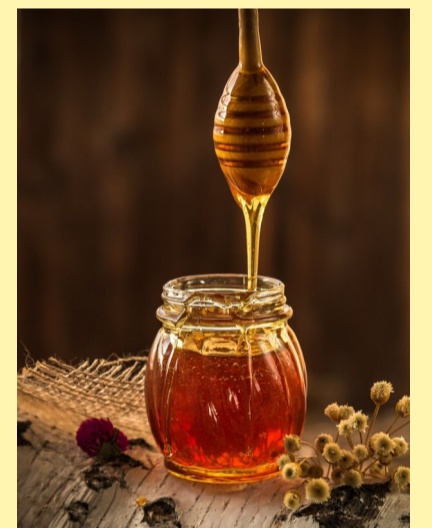
Miel cruda medicinal

Los productos de las abejas y sus beneficios: Las abejas son responsables de la producción de miel, polen, cera, jalea real y propóleo, todos con propiedades medicinales, en el caso de la miel es un alimento natural y saludable con propiedades antibacterianas.