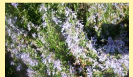
Floración de romero

Plantas melíferas, alimento de las abejas: Una planta melífera es aquella que produce flores que segregan néctar accesible a las abejas u origina melazas, aunque se tendría que extender a todas aquellas plantas que producen polen aprovechable por las abejas.