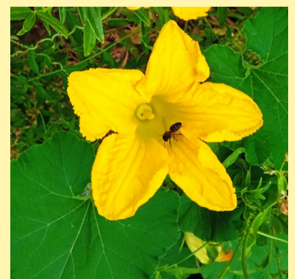
Abeja en cultivo ecológico de calabaza