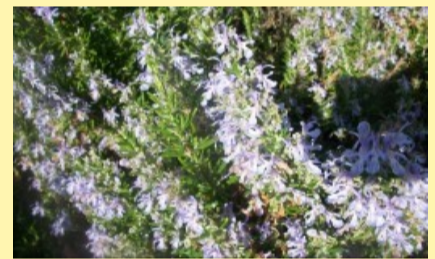
Floración de romero, planta aliada de la agricultura ecológica, refugios de insectos beneficiosos para controlar plagas